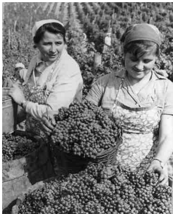
9. kép Szőlőszedés a Munkácsi Szovhoz szőlészetében, 1964 októbere