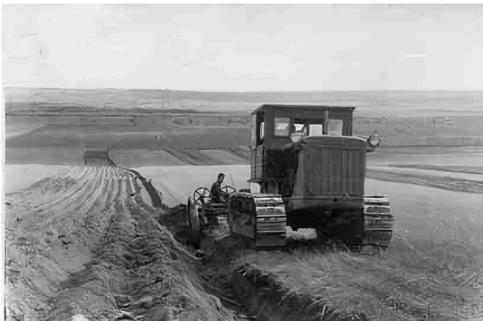
4. kép Az ungvári Kirov Kolhoz mezőjén szántó traktor, 1954