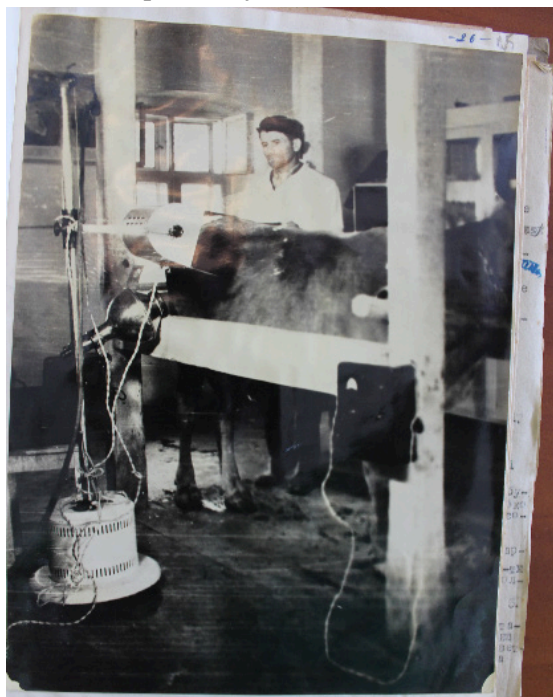
7. kép Técsői járási állatklinika