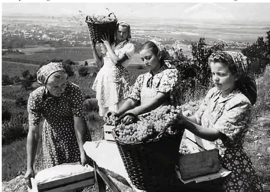
1. kép A Beregszászi Szovhoz munkásnői szőlőszedés közben, 1956. augusztus 13.