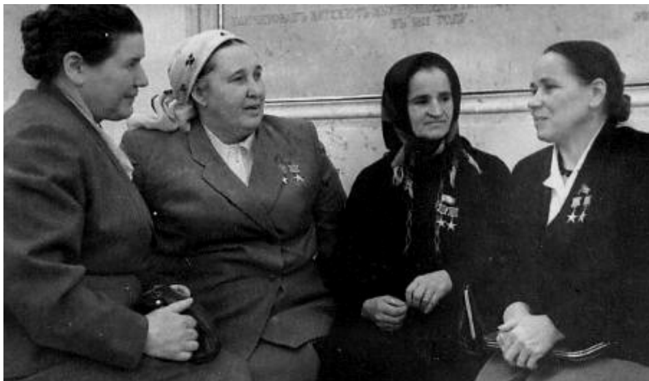
8. kép Ladányi Hanna, a Szocialista Munka kétszeres Hőse az SZKP KB plénumán Moszkvában, 1961. január 12.