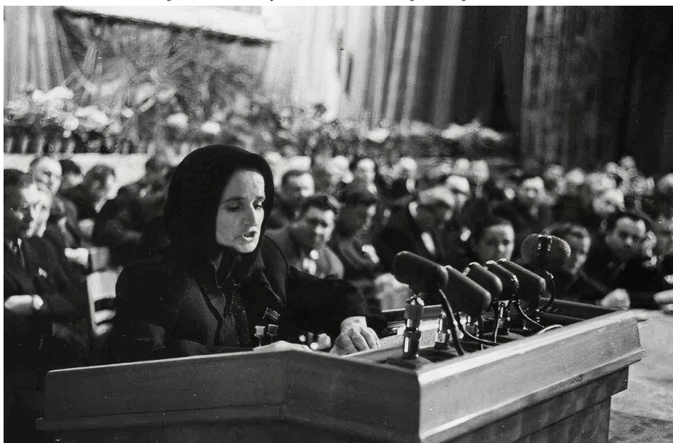
5. kép Ladányi Hanna, a Szocialista Munka kétszeres Hőse az ukrajnai állattenyésztők találkozásán Kijevben, 1958

Forrás: http://photo.rgakfd.ru/photo/425698/ , letöltés 2021. júl. 26.