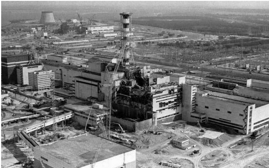
2. kép A felrobbant csernobili reaktor