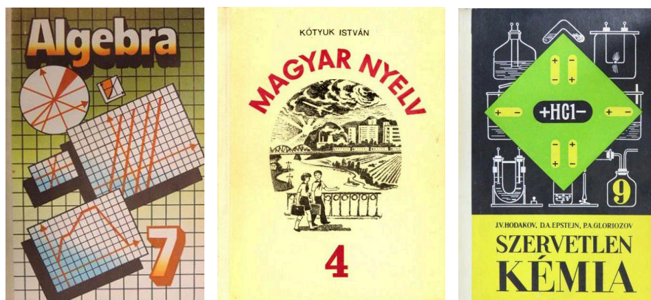
6. kép Algebra, 1991-es; Magyar nyelv, 1987-es; Kémia, 1987-es kiadás