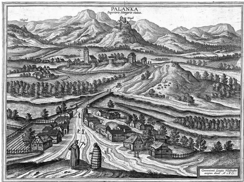
Ipolyhídvég és Drégelypalánk (Palánka) képe, 1617