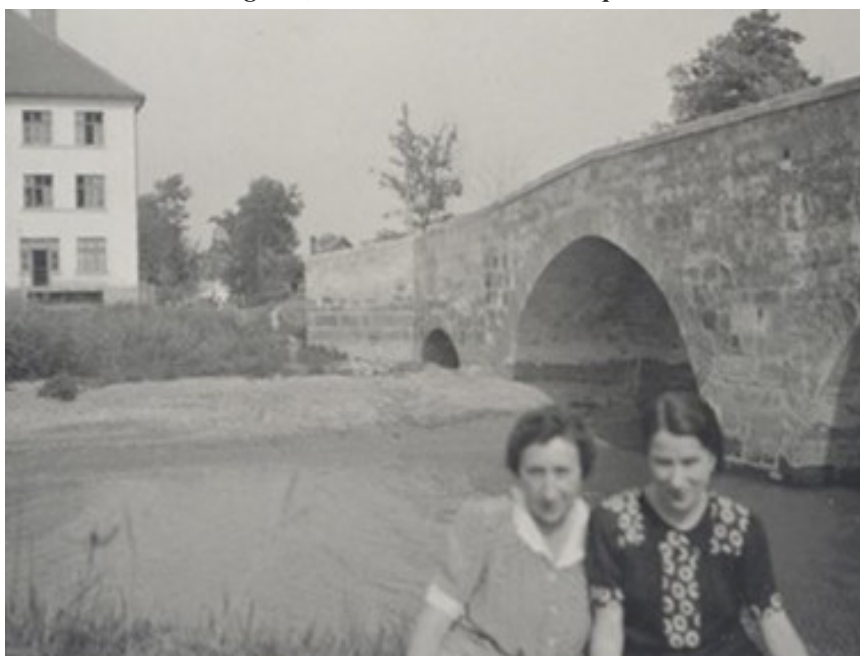
A régi híd, ami összekötötte a két települést

A mélyinterjúkból kiderült, hogy az emberek talán a legnagyobb problémának a folyó két oldalán lévő magyar közösségek szétszakítását és az ezzel járó emberi, családi, közösségi hátrányokat tartják. A két falu közösségének organikus kapcsolata viszont nem enyészett el az elmúlt száz évben. Az első időben igyekeztek kihasználni az illegális átlépés, látogatás, egymás közötti kereskedelem lehetőségeit (lásd Knotter „határparadoxon” kategóriájánál leírtakat). A martinezi tipológiában ez az állapot legközelebb a második típushoz állt. A schengeni szabályozás életbelépése után a két falu