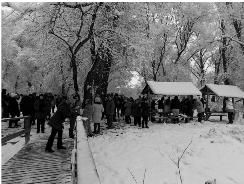
Szilveszteri ünnepi találkozó a „szeretet hídon” 5