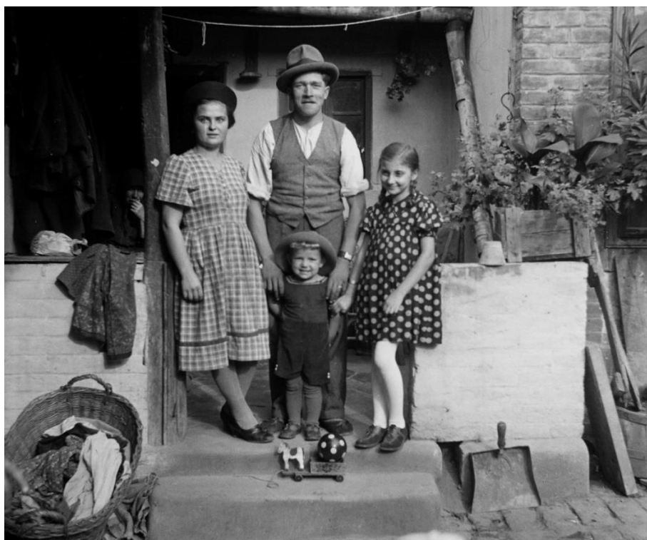
16-17. kép: Hunyady József feleségével és két gyermekével (1948)