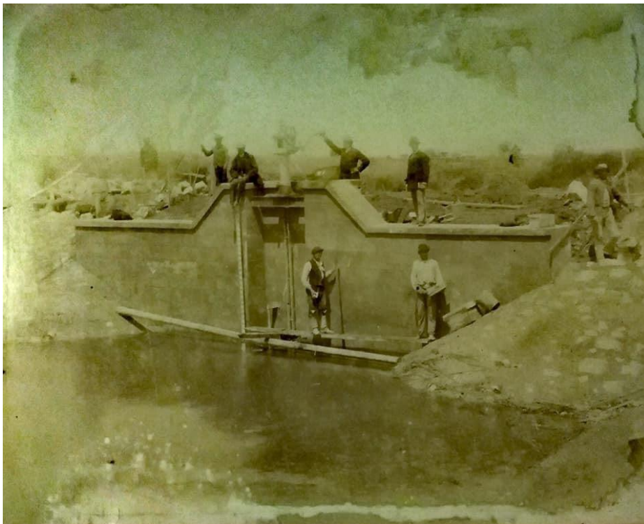
12-13. kép: A Borzsa folyó duzzasztó gátjának építése és elkészült állapota