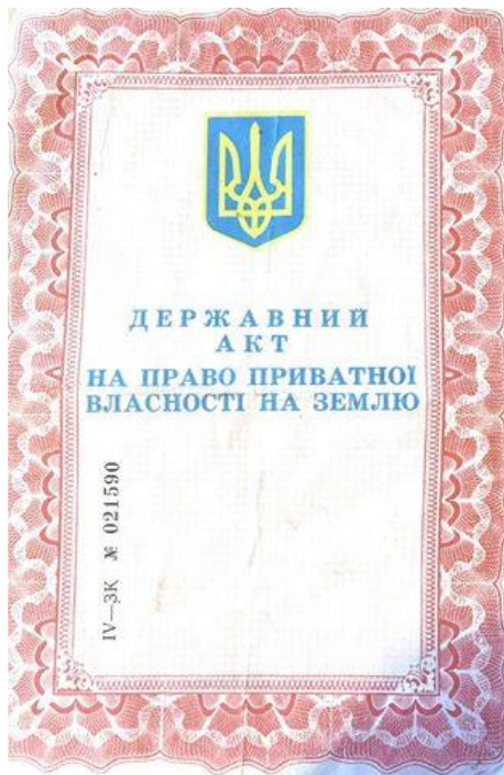
(Bíró Irén tulajdona)

Állami törvény a magánszemélyek földhöz való jogáról