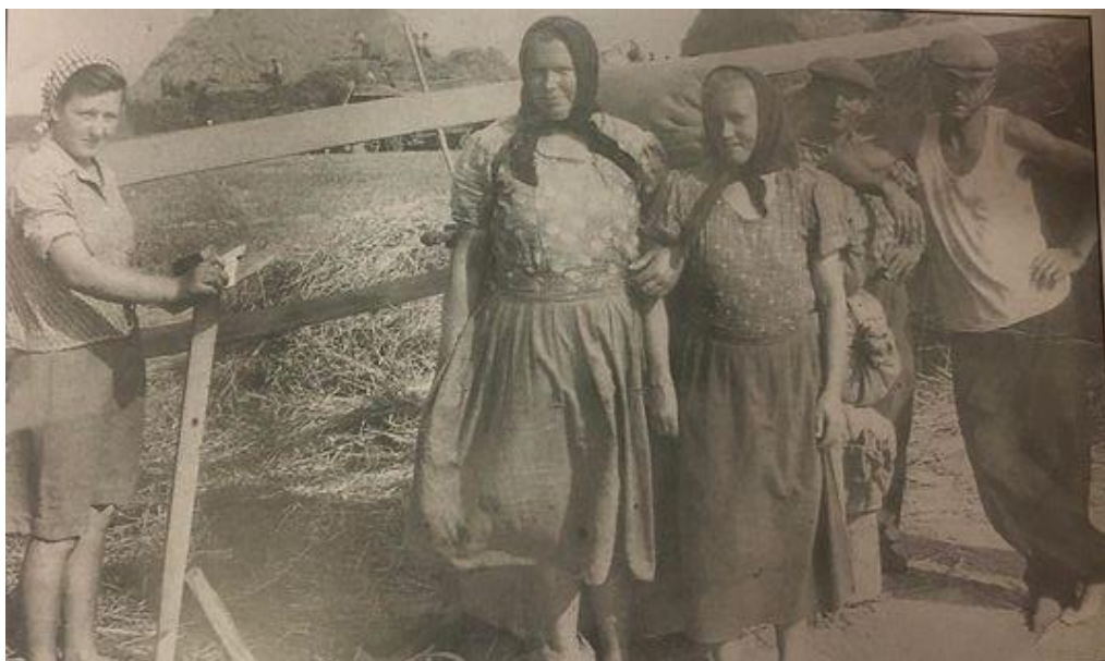
Forrás: Sassné Sándor Ibolya: Csongor. Ahol az ég összeér a földdel...(Falukönyv). Kárpátaljai Magyar Kulturális szövetség, Csongor, 2021.