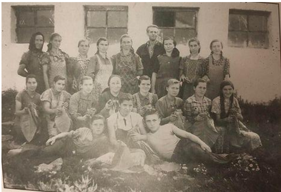
Forrás: Sassné Sándor Ibolya: Csongor. Ahol az ég összeér a földdel...(Falukönyv). Kárpátaljai Magyar Kulturális szövetség, Csongor, 2021.