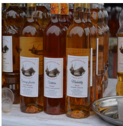
2. ábra. A borutca egyik borászáinak kétnyelvű kínálata (A) és egy-nyelvű ukrán borkinlát az ételstandok között (B)

Az italokat (főként bor és házi pálinka) kínáló standoknál csak a Kárpátaljai Magyar Borászok Egyesülete által kialakított „borutcában” informálódhattunk többnyire kétnyelvű kiírásokból, míg a többi helyen csak államnyelvi feliratokkal találkozhattunk. Azonban a borutcában is volt olyan borász stand, ahol a cégér kétnyelvű volt, de a bornevek csak ukrán nyelven voltak feltüntetve (lásd 2. ábra). A házi készítésű és kézművessütemények, termékek esetében csak a két szomszédos magyar település termékeinek olvashattuk magyar nyelvű elnevezéseit a cégtábláik mellett.