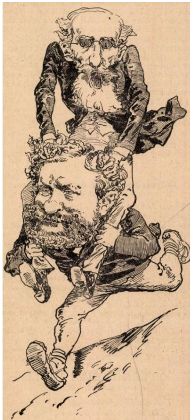
2. ábra: A Bolond Istók karikatúrája Dobránszky és Tisza viszonyáról

Forrás: Bolond Istók, 1882. (26. szám) június 25., p. 8.