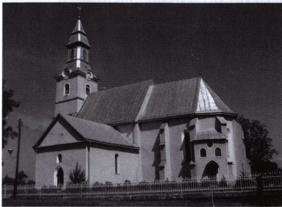
A nagybereg-i templom épülete napjainkban

A református templomok zöme Kárpátalján jelentős múlttal bír, hisz sokuk még a reformáció előtt épült, s csak a protestantizmus terjedésével került jelenlegi tulajdonosukhoz úgy, hogy a falu lakossága a földesurát követve tért át a katolikus hitről a megreformáltra. Így történt Nagyberegen is. Alábbi írás a nagybereg-i református templom történetileg igazolható sors-alakulásáról szól.