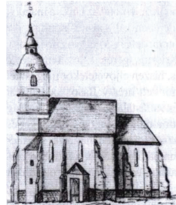
A templomról fennmaradt egyik legrégebbi rajz

1936-ban a száz évvel korábbi toronyórát egy modernebb típusra cserélték, amelyet 10 ezer cseh koronáért vásárolt az egyházhatánács. Ez a toronyóra ma nem jár, pedig állítólag minden fogaskereke ép.