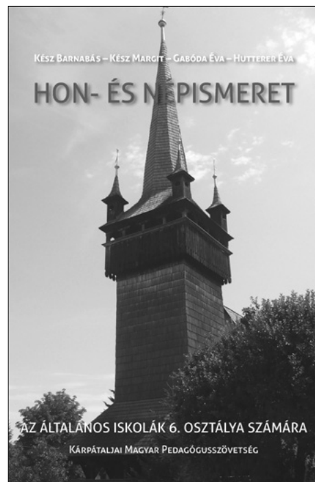
2. kép. A 6. osztályos új Hon- és népismeret tankönyv borítója