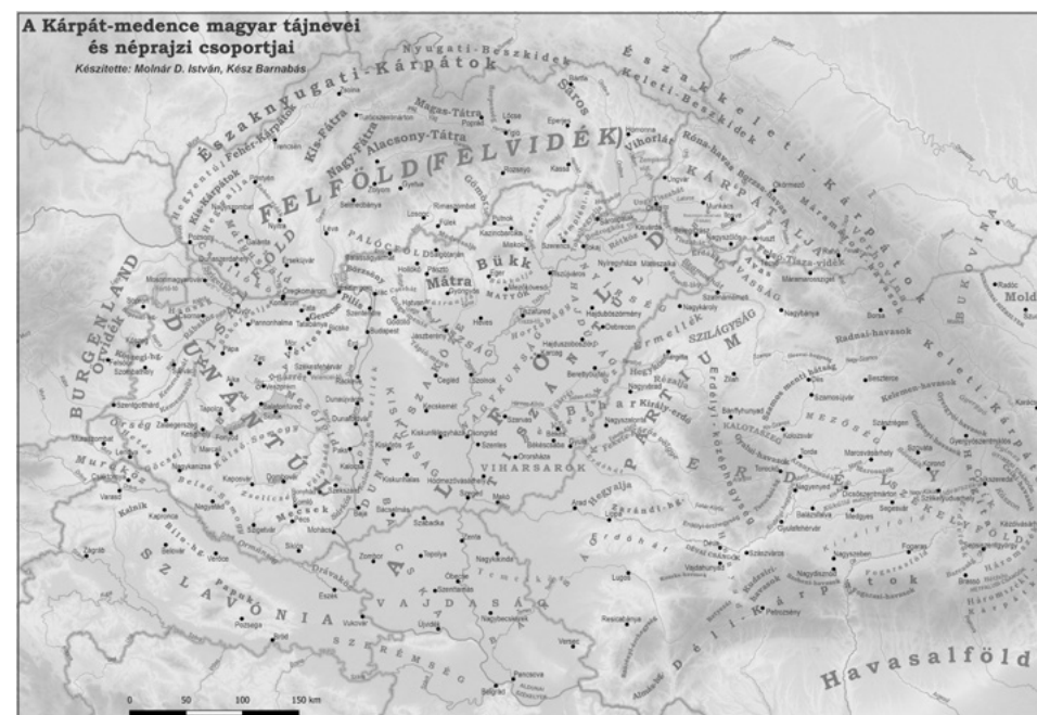
4. kép. A Kárpát-medence magyar tájai és néprajzi csoportjai (a térképet készítette: Molnár D. István és Kész Barnabás)