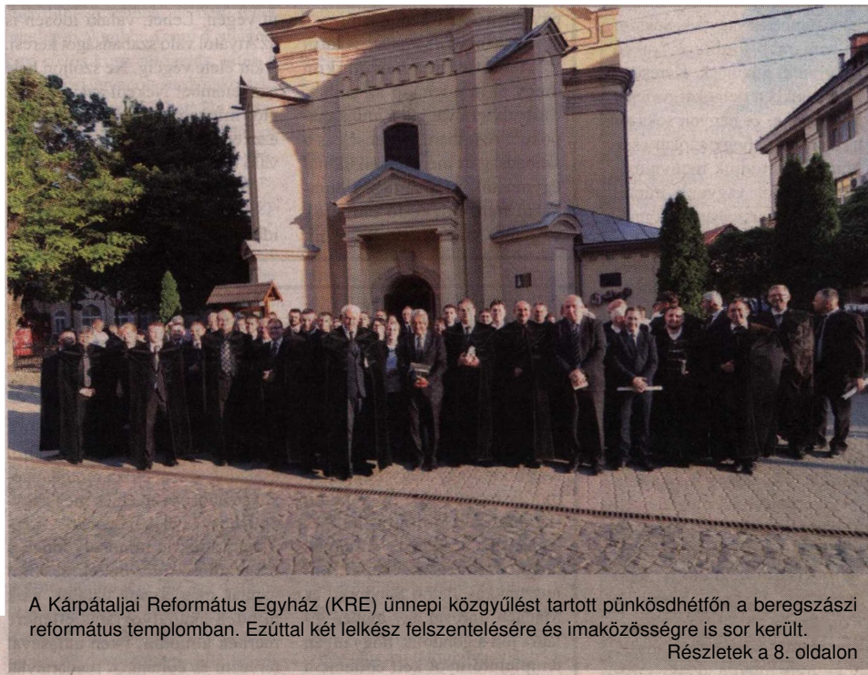
A Kárpátaljai Református Egyház (KRE) ünnepi közgyűlést tartott pünkösdhétfőn a beregszászi református templomban. Ezúttal két lelkész felszentelésére és imaközösségre is sor került.