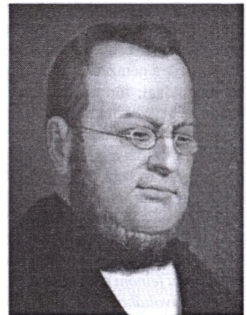
Camillo Bens di Cavour gróf (1810-1861)

zadt az egész környék; Piemont fel l, hátulról fenyegetnek. ” 13 Eztán a lombardiai várnégyszögbe volt kénytelen menekülni, 14 s védelemre rendezkedett be. A mindezidáig mérsékelt politikát folytató Cavour a Risorgimento 15 március 23-i vezércikkében ezt írta: „... a szárd királyság számára elérkezett a dönt óra: egész léte és jöv je, attól függ, vállalja-e a vezet szerepet az ország függetlenségi harcában, vagy elmulasztja a megfelelő pillanatot. ” 16