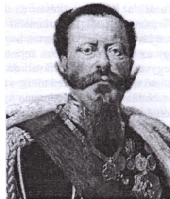
II. Viktor Emánuel, Olaszország első királya

Cavour mindig gyanakodva nézte Garibaldit, az őt viszont soha, pedig szülőföldjét, Nizzát engedte át a franciáknak. Cavour, Bismarckhoz hasonlóan, nélkülözhetetlennek tartotta magát. Garibaldi, mint idealista, a hazát, Cavour önmagát tartotta a legfontosabbnak - véli Taylor. 36 S bár Garibaldi nem igazán volt intellektuális alkat, ösztönösen talált rá a helyes útra. Ezt az emberi sikert irigyelte tőle Cavour, s még a királynál is rossz hírére keltette. Az idealista Garibaldi forradalmat csinált, a gyakorlat-