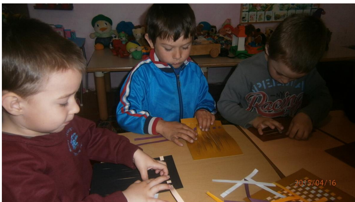
16. fotó. A Macsolai óvodások papírszövése