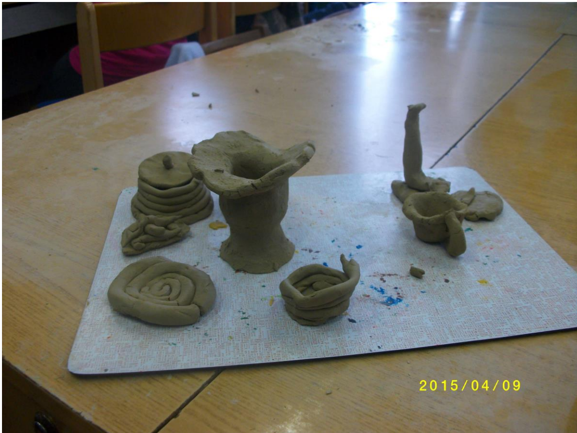
11. fotó. Az agyagból készült alkotások