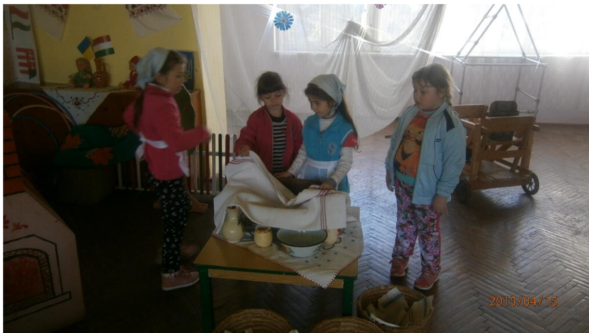
3. fotó. Kenyérsütés a gyerekek közreműködésével