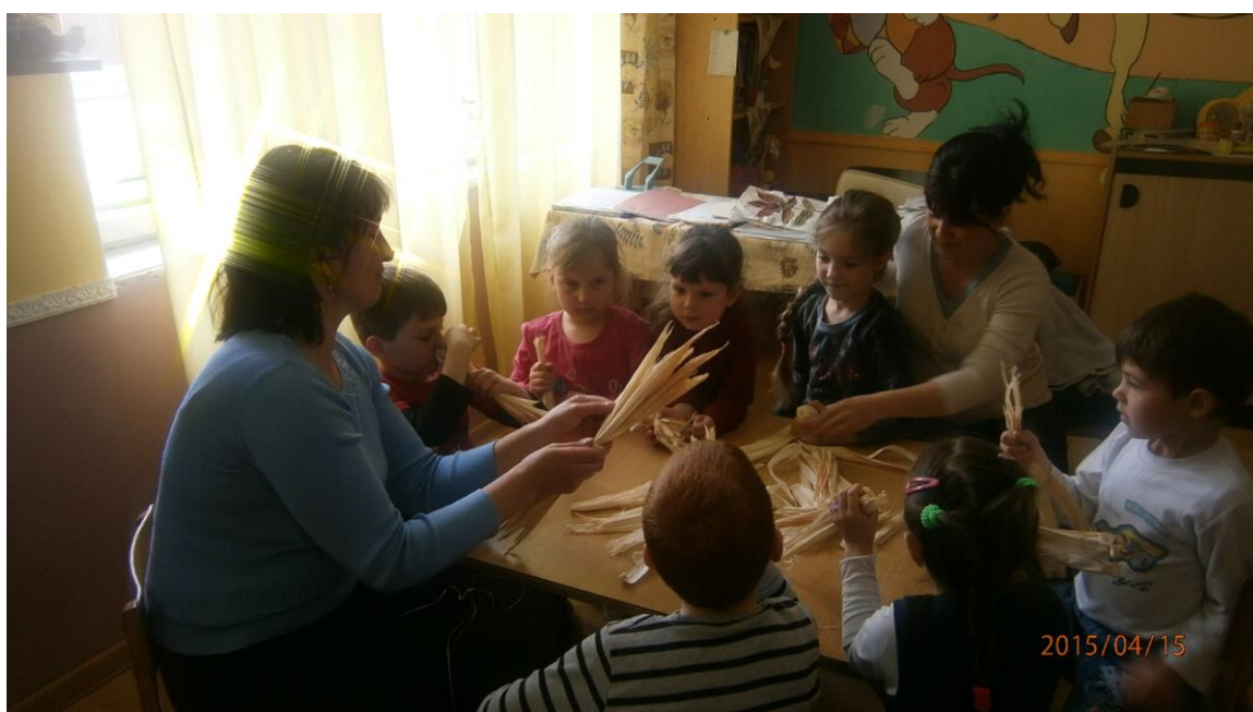
14. fotó. A csutkababa készítésének bemutatása