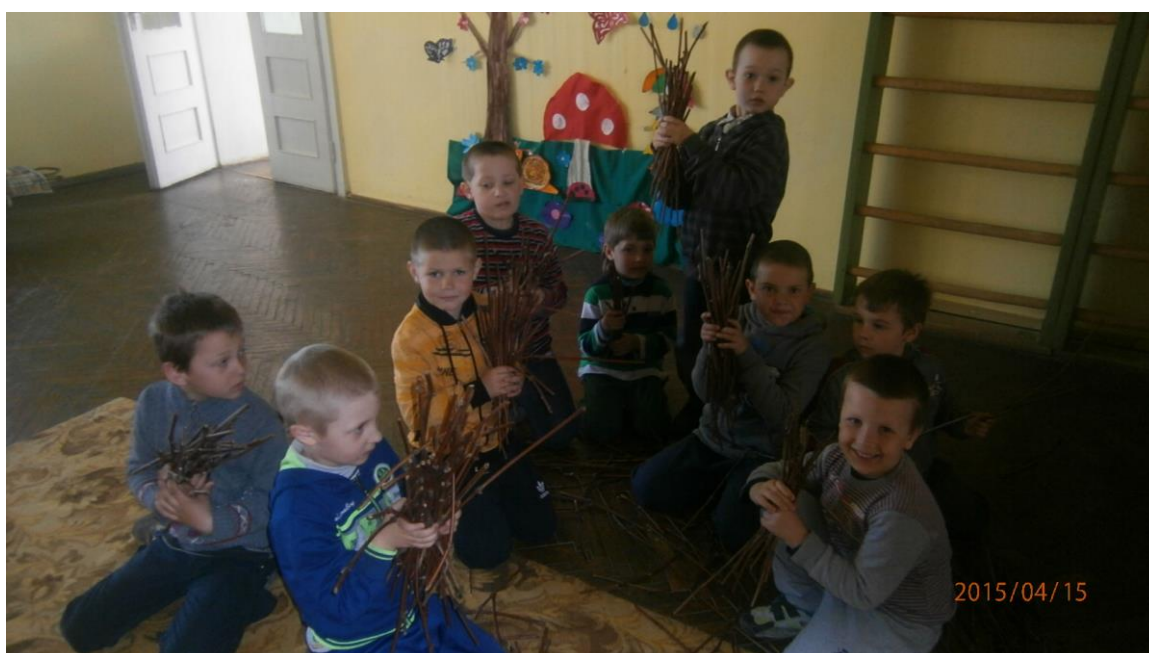
4. fotó. Venyige gyűjtés a kemence befűtéséhez