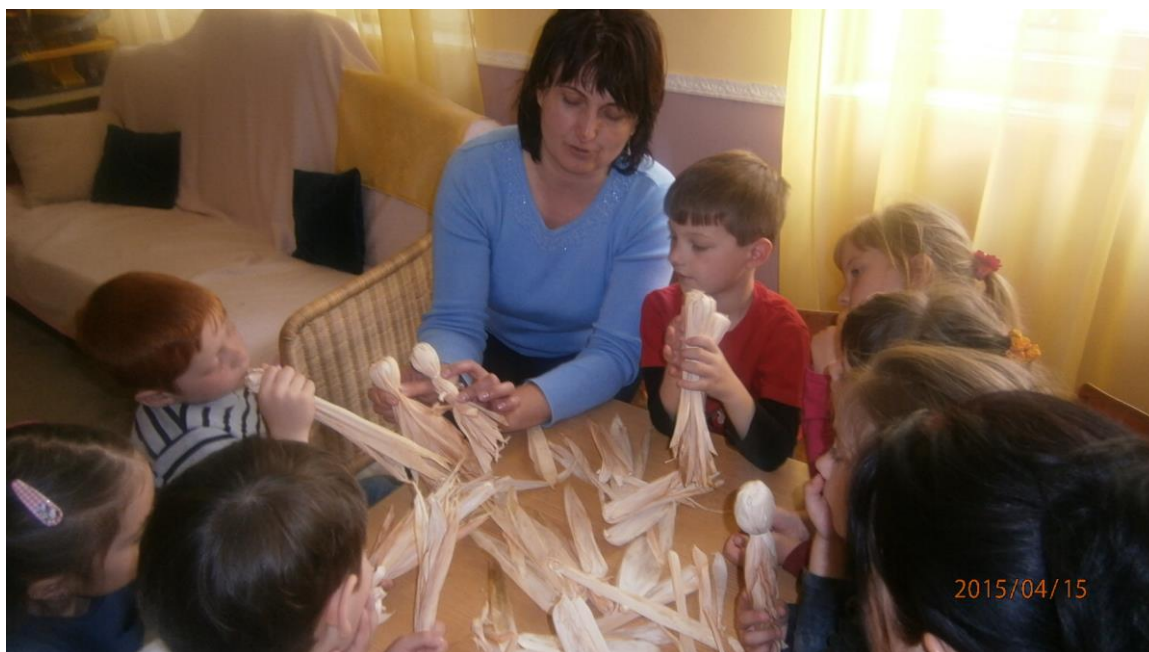
15. fotó. Elkészült munkáink