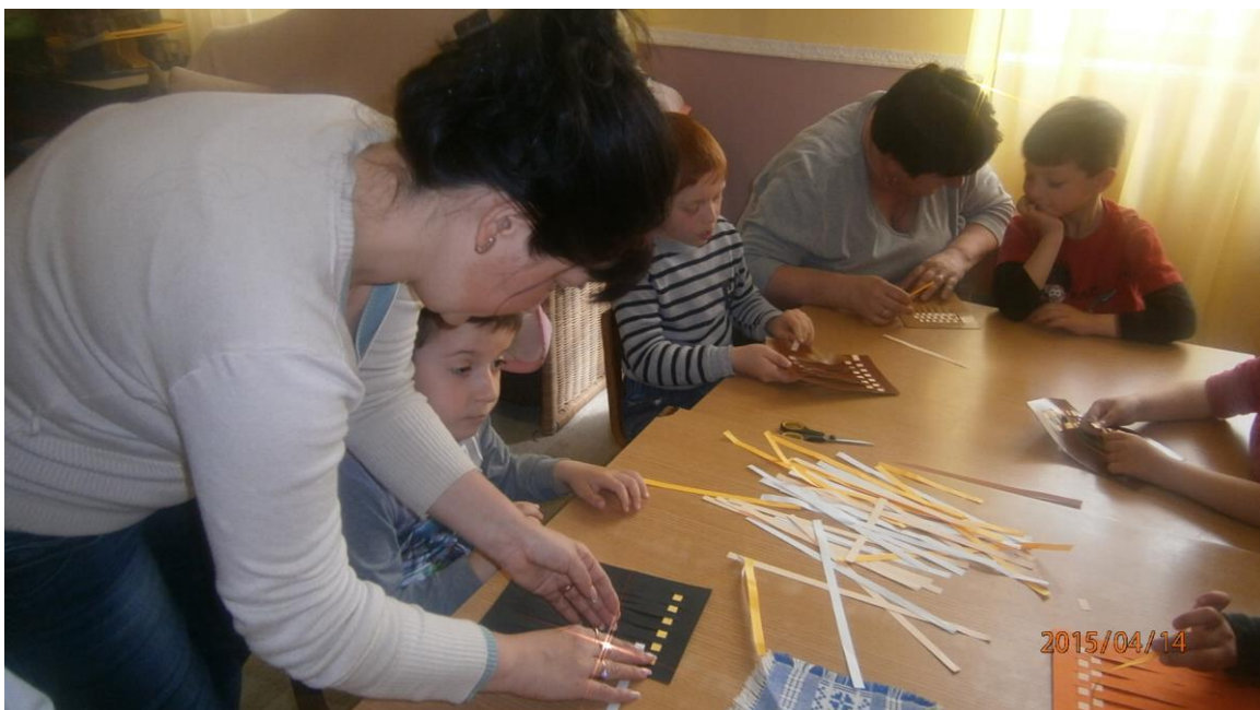
12. fotó. Szövés papíron az óvónők segítségével a Kígyósi óvodában