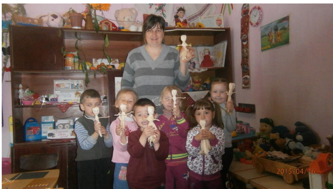
20. fotó. Munkánk gyümölcse