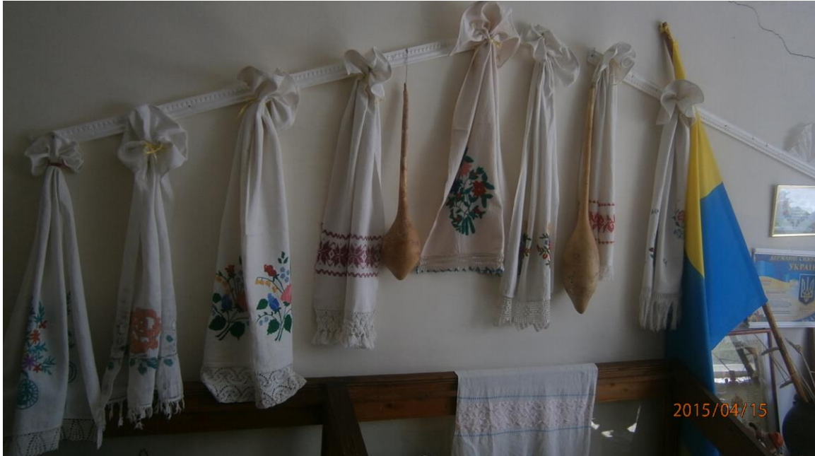
1. fotó. Népművészeti kiállítás a Vári óvodában