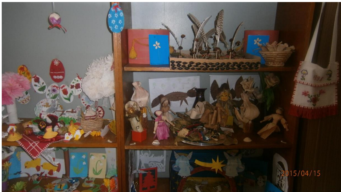
2. fotó. Kézműves kiállítás a gyerekek munkáiból