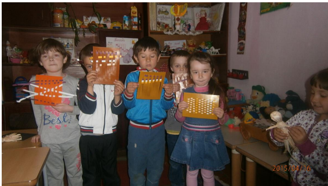
19. fotó. Alkotásaink