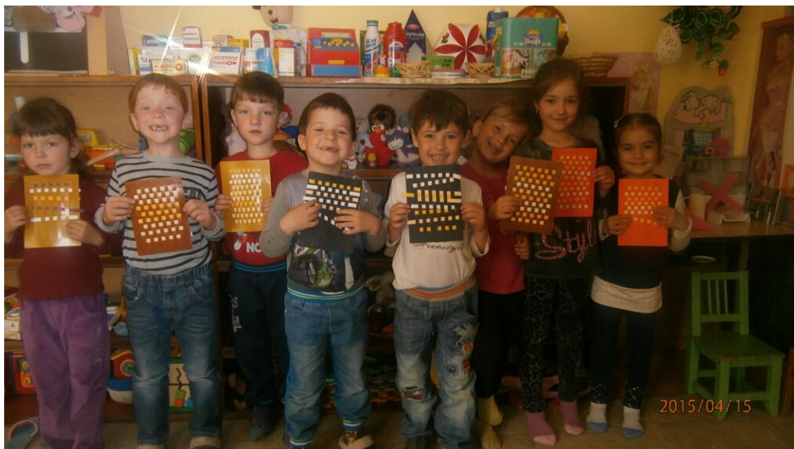
13. fotó. A gyerekek az elkészült alkotásaikkal