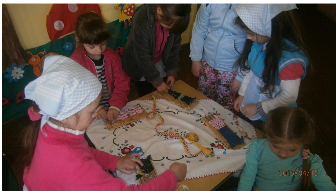
6. fotó. Szövés szövőkereten