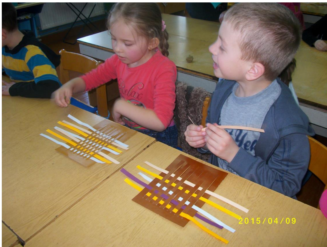
9. fotó. Papírszövés