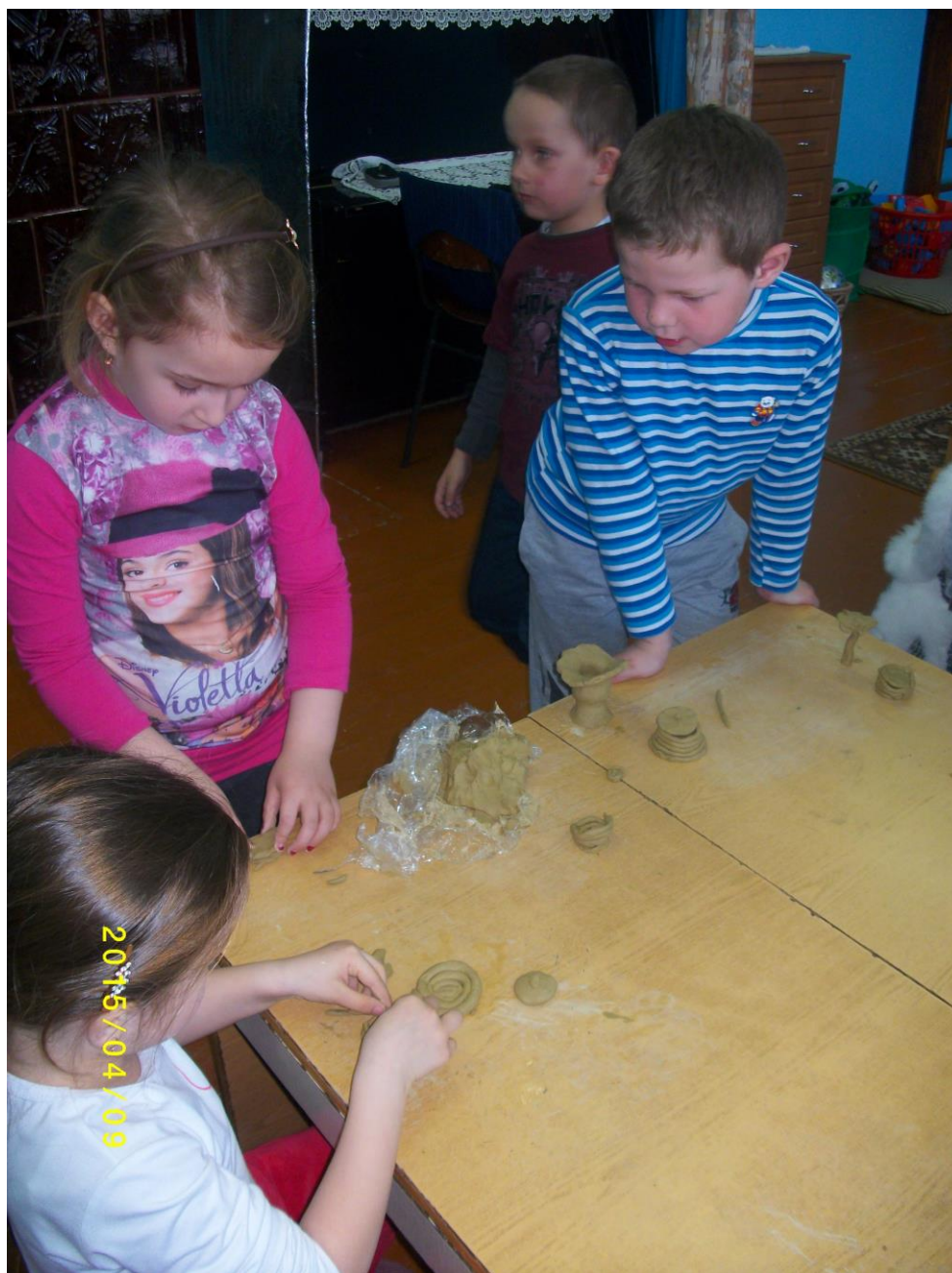
10. fotó. Agyagozás