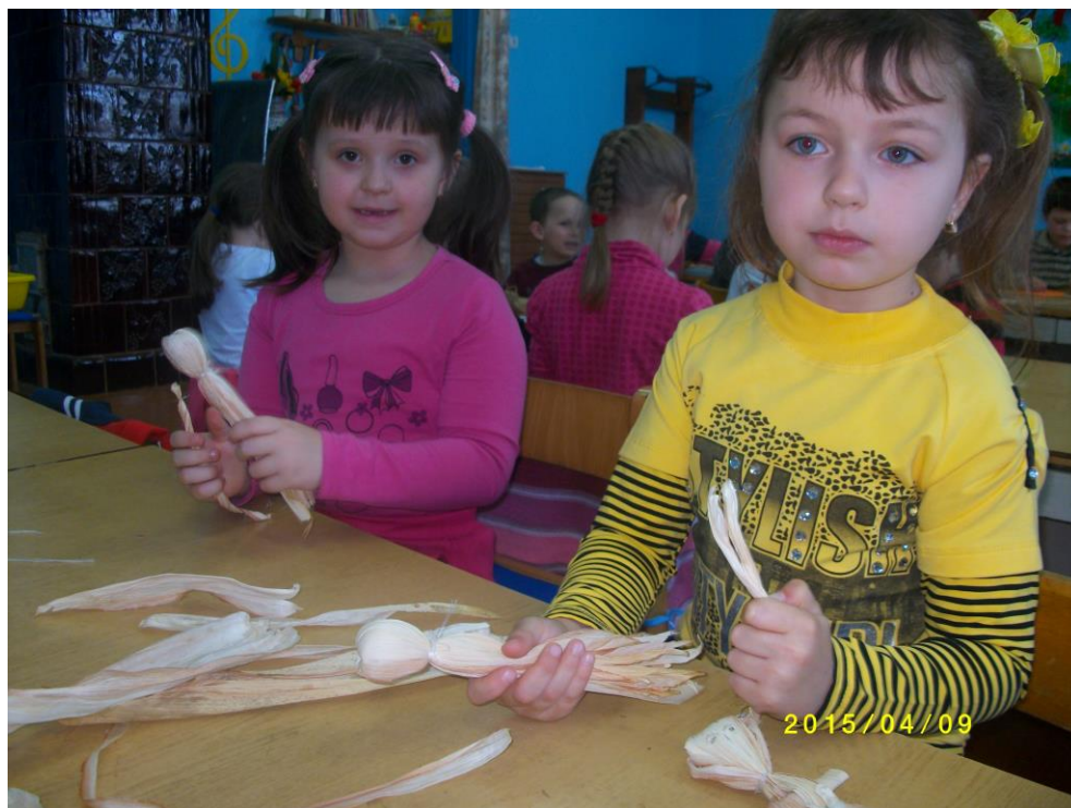
8. fotó. Csutkababa készítés