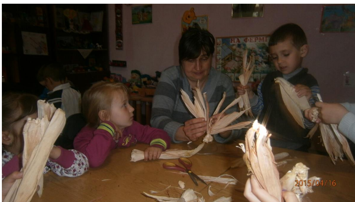
18. fotó. A Macsolai óvónő „segítő kezei”