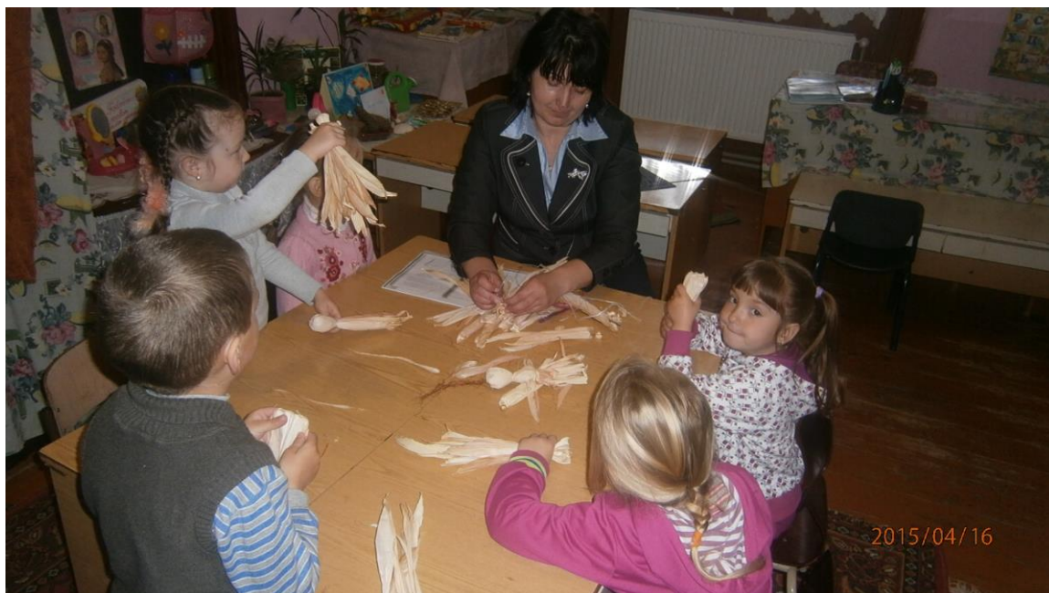
17. fotó. A Macsolai óvodások csuhébabái