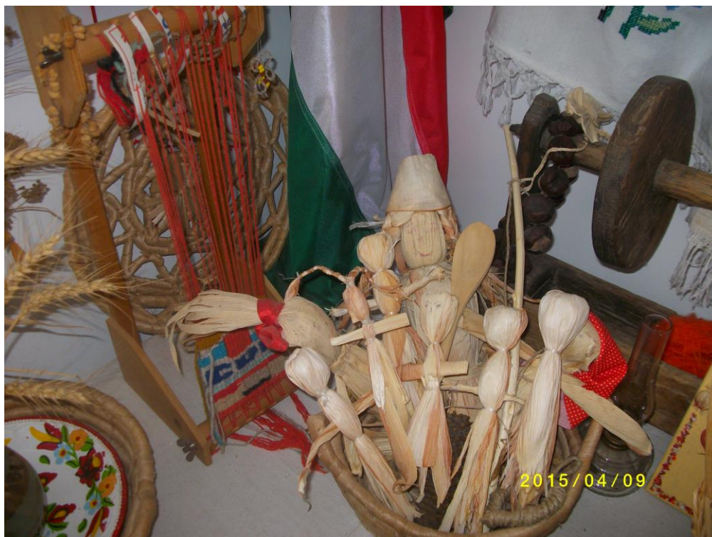
7. fotó. Kézműves sarok a Beregújfalui óvodában