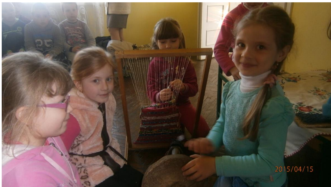
5. fotó. Készül a rongyszőnyeg